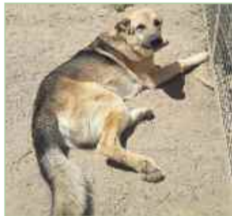
SPIRIT.- 5 años de edad.