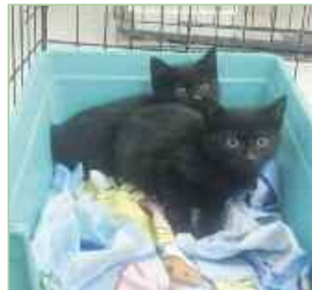
ALPISTE Y ARROZ.- Gatos de la misma camada, no llegan al año de edad.