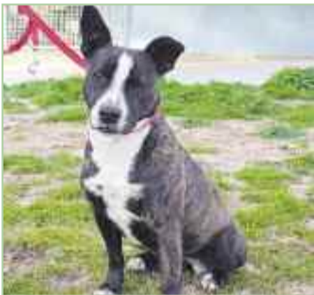
GRETA.- 4 años de edad.