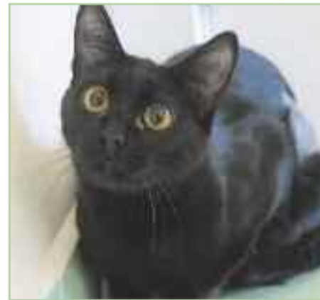
MOLLY.- Nacida en abril del 2018. Fue rescatada de una colonia donde apareció sola y tenía mucho miedo, por lo que creemos que fue abandonada. Es una gata tímida con personas en un primer momento, aunque cuando coge confianza es cariñosa. Se lleva a la perfección con gatos y perros. Es positiva a inmunodeficiencia felina, lo cual unido a su color negro, ya que las panteras tienen menos posibilidades de que alguien se fije en ellos, complican su adopción.