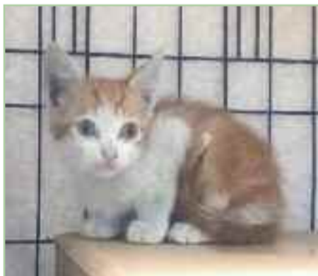
GUTI.- Cachorro de 2 meses de edad.