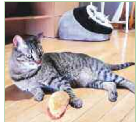
ELSA. Nacida en marzo del 2016. Elsa llegó con unos días de vida y hubo que darle biberón. Ella ha tenido muy mala suerte y por desgracia ha ido cambiando de casa en demasiadas ocasiones. Ahora está en una casa de acogida estable donde se ha adaptado muy bien tanto a la persona que la cuida como a sus dos gatas. Necesita una casa tranquila y donde pueda recibir cariño y un trato dulce.

Centro Integral Municipal de Protección Animal de Alcalá de Henares ha experimentado una profunda transformación y mejora quedando convertidas en un verdadero centro integral basado en el concepto de bienestar animal y adaptado a las más exigentes tendencias en la materia. Actualmente está gestionado por la asociación FAPAM. Dirección: Carretera M-300, Km 2,100 Alcalá de Henares - 91 056 33 42 Horario: De lunes a domingo, de 10:00 a 14:00 y de 16:00 a 20:00 h. Fuera de este horario los avisos se atenderán como urgencias a través de Policía Local de Alcalá de Henares.