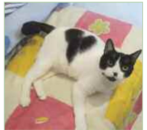
WILSON.- Nacimiento noviembre de 2016. Llegó a la asociación después de que su pata hubiera sido seccionada por un cepo. Es un gato tranquilo y cariñoso, quienes le conocen solo hablan maravillas por su carácter tan extraordinario. En su casa de acogida convive con más gatos y perros, con los que se lleva muy bien.