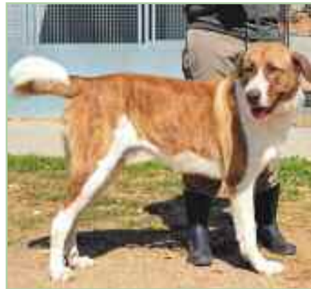
HARRY.- 2 años de edad.