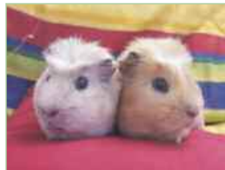
COBAYAS.- Hace pocos días llegaron al un par de cobayas muy pequeñas.