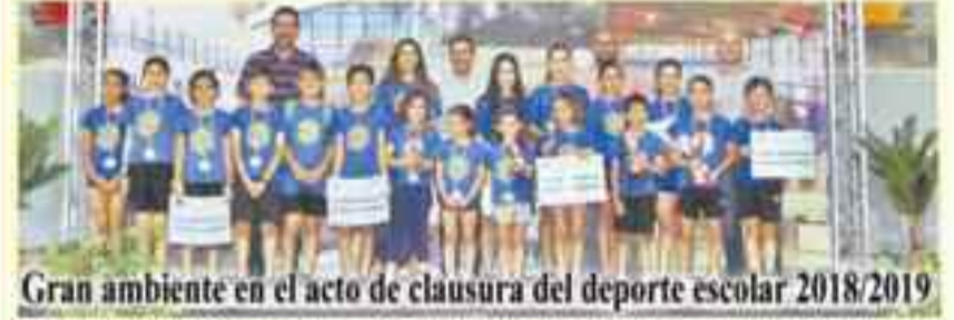
Gran ambiente en el acto de clausura del deporte escolar 2018/2019