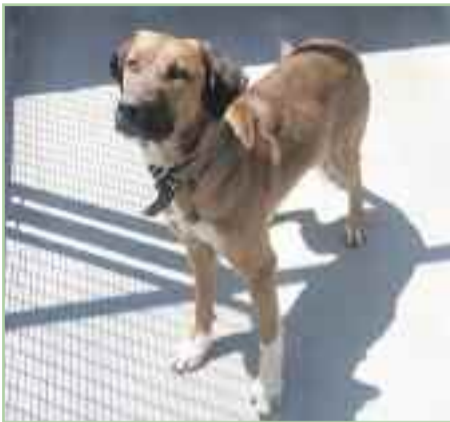
EROS.- Mastín color canela, 1 año.