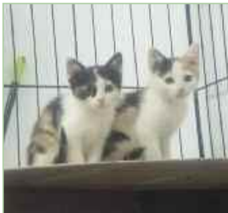
PILI Y MILI.- Gatos de una misma camada, tienen sólo 2 meses.