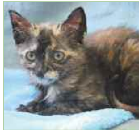
KENIA.- Nacida en abril del 2019, tuvo que ser hospitalizada debido a la gravedad de su estado cuando fue encontrada en la calle. Se ha recuperado totalmente. Es una gata muy juguetona, activa, cariñosa y alegre.