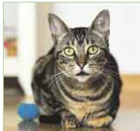
FLORA.- Nacida en el 2016 Es una gata tímida en el primer encuentro pero cuando coge confianza es muy cariñosa. Es una gran amiga de gatos y perros, con los que convive sin problema.