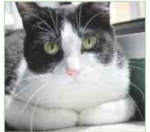
LAZY.- Nacida en mayo de 2018. Es una gata muy buena y dulce, convive a la perfección con otros gatos y perros. Con personas es muy cariñosa. Una compañera perfecta.